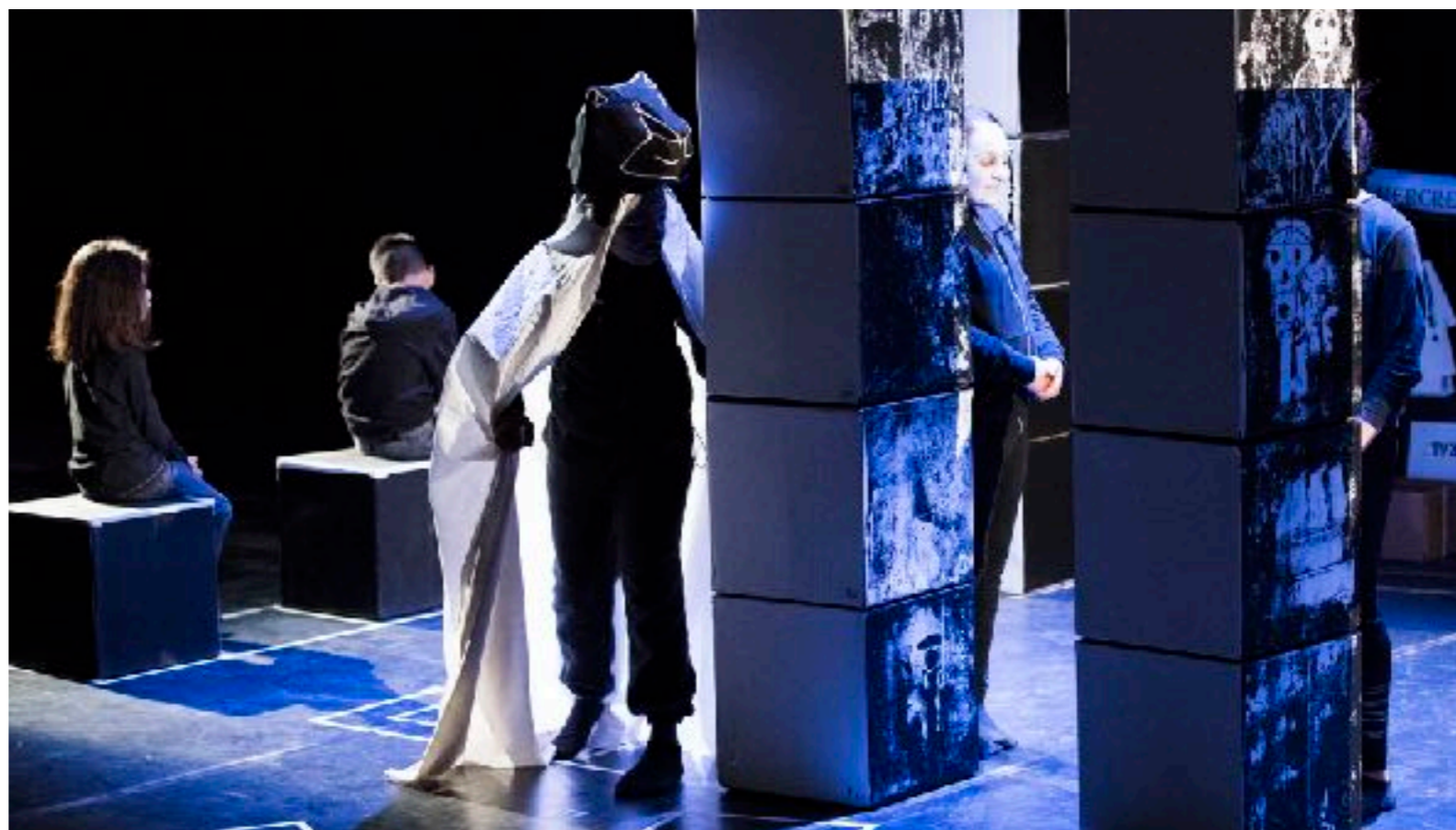
TOUT CRU 26 Mars 2019 festival « Tous en Sons »

La réservation d'un bus de ville nous a également permis de transporter des familles de La Busserine à la représentation à Aix en Provence.