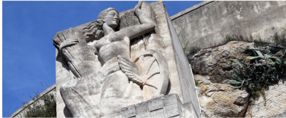
La devise de la ville des Pennes Mirabeau : « sur les ailes du vent »

Construit au XXe siècle, le tunnel reliant le centre du bourg à l'avenue François Mitterrand (ancienne RN113) fut endommagé lors des combats de la Libération en août 1944. Il est orné aujourd'hui d'une allégorie des Pennes (jeune femme aux longs cheveux dénoués, portant une gerbe de blé et accostée d'une roue ailée), avec la devise des Pennes "sur les ailes du vents".